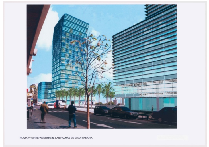
PLAZA Y TORRE WOERMANN, LAS PALMAS DE GRAN CANARIA