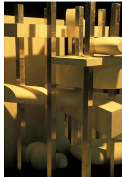
OMA, Projet de concours pour la Très Grande Bibliothèque, 1989. © Office for Metropolitan Architecture (OMA)