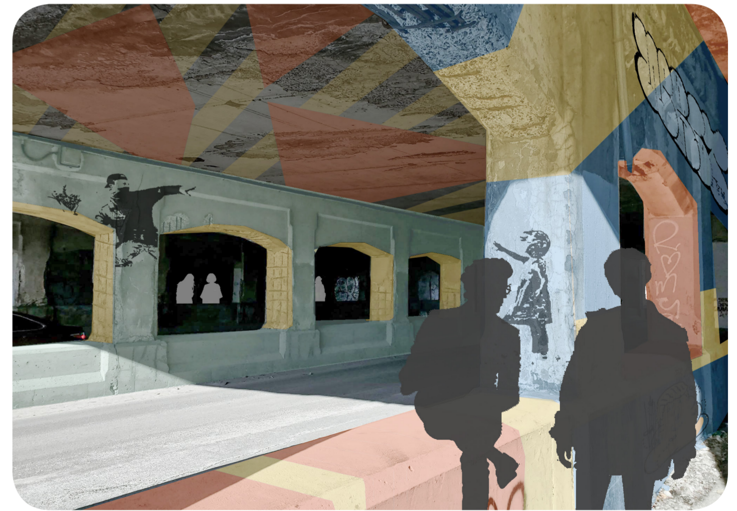
VUE DE L'INTÉRIEUR DU PASSAGE