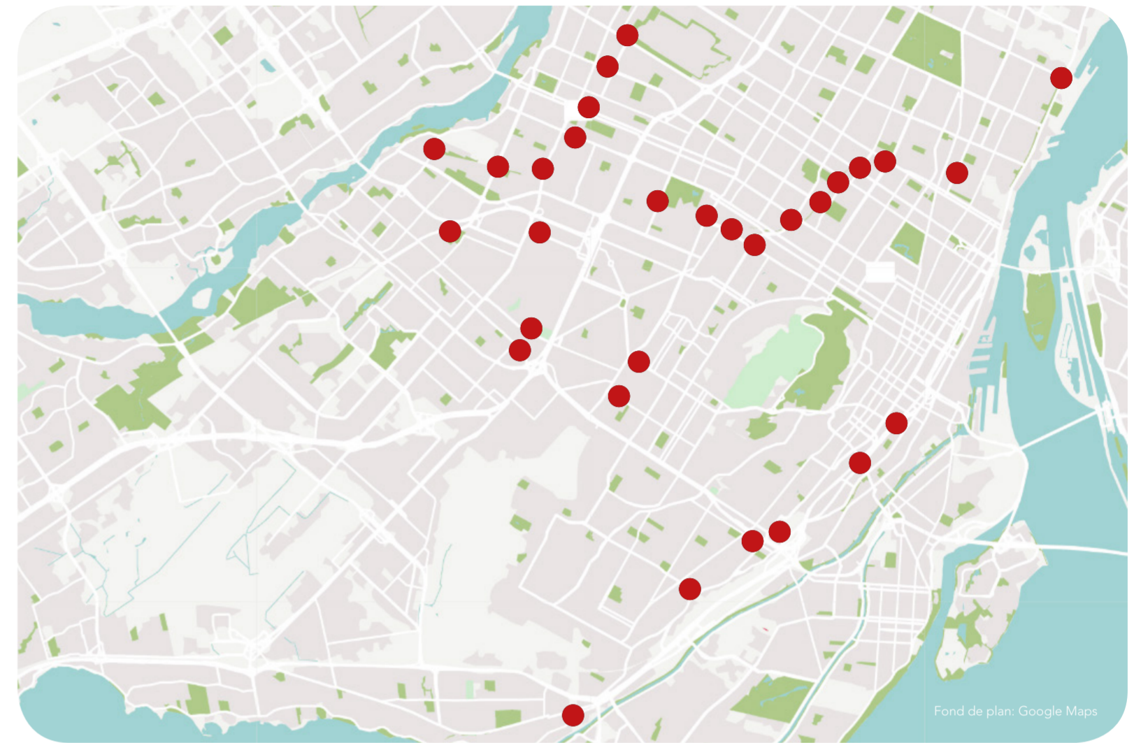
PLAN DES INTERSECTIONS DÉSAGRÉABLES ENTRE UNE RUE ET UNE VOIE FERRÉE

Plus spécifiquement, le projet se penche sur le croisement de la rue Hochelaga et de la voie ferrée. Ce passage se situe entre une zone hautement résidentielle et le métro Préfontaine. C'est donc déjà un espace assez animé, mais le passage en tant que tel est plutôt désolant. Le quartier est en plein développement, il est donc important d'impliquer la communauté dans ces changements qui frappent trop souvent les quartiers Montréalais sans que les citoyens aient leur mot à dire. On peut voir, aux alentours, qu'il y a déjà un désir de se réapproprier le chemin de fer, par le Mur légal (Graffiti), par exemple. Cela semble donc être l'opportunité parfaite à exploiter.