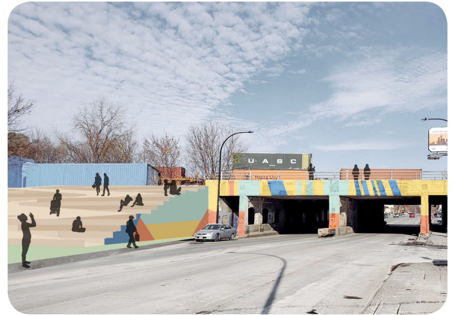
VUE DU COIN HOCHELAGA / FLORIAN