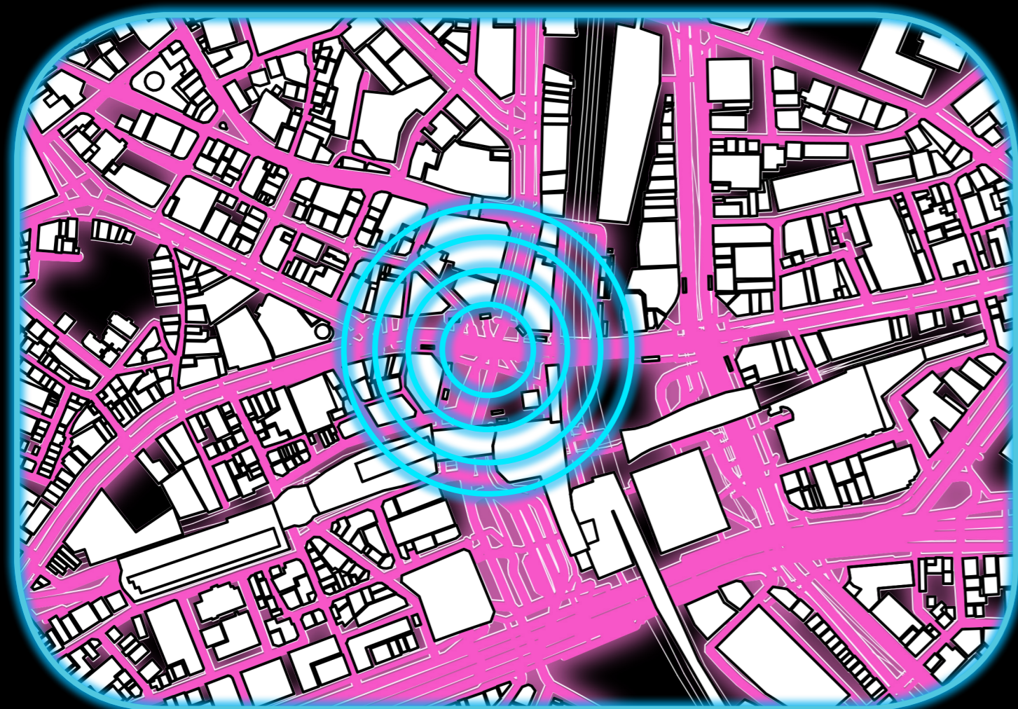
CARREFOUR HACHIKO, SHIBUYA, TOKYO

SE TROUVANT DANS L'ARRONDISSEMENT DE SHIBUYA, L'INSTALLATION PREND PLACE SUR LE CARREFOUR HACHIKO TRAVERSÉ PAR 2.4 MILLIONS DE PERSONNES CHAQUE JOUR. S'IMPOSANT SUR L'INTERSECTION, LE PROJET SE VEUT UNE PAUSE OBLIGÉE DANS LE RYTHME DE VIE EFFRÉNÉ PRÉSENT DANS CE QUARTIER.