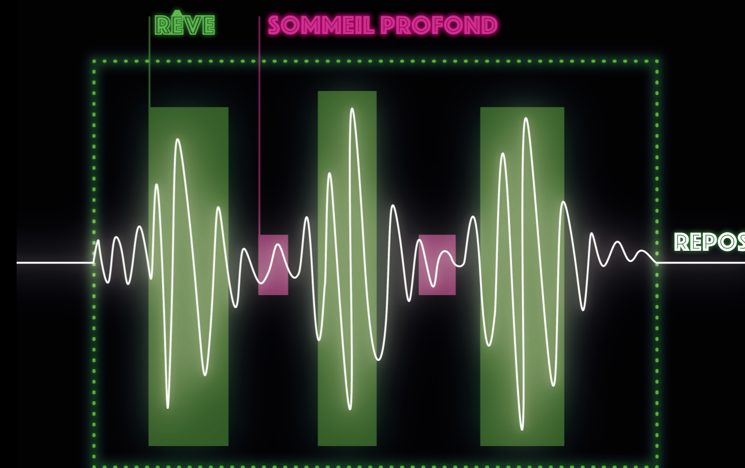
ACTIVITÉ CÉRÉBRALE DURANT LE RÊVE

LA 25È HEURE DEVIENT AINSI CELLE DE LA PAUSE ET DU REPOS. ELLE SE VEUT MOBILE DANS LA NUIT ET APPROPRIABLE PAR TOUS LORSQUE LE BESOIN SE FAIT RESENTIR.