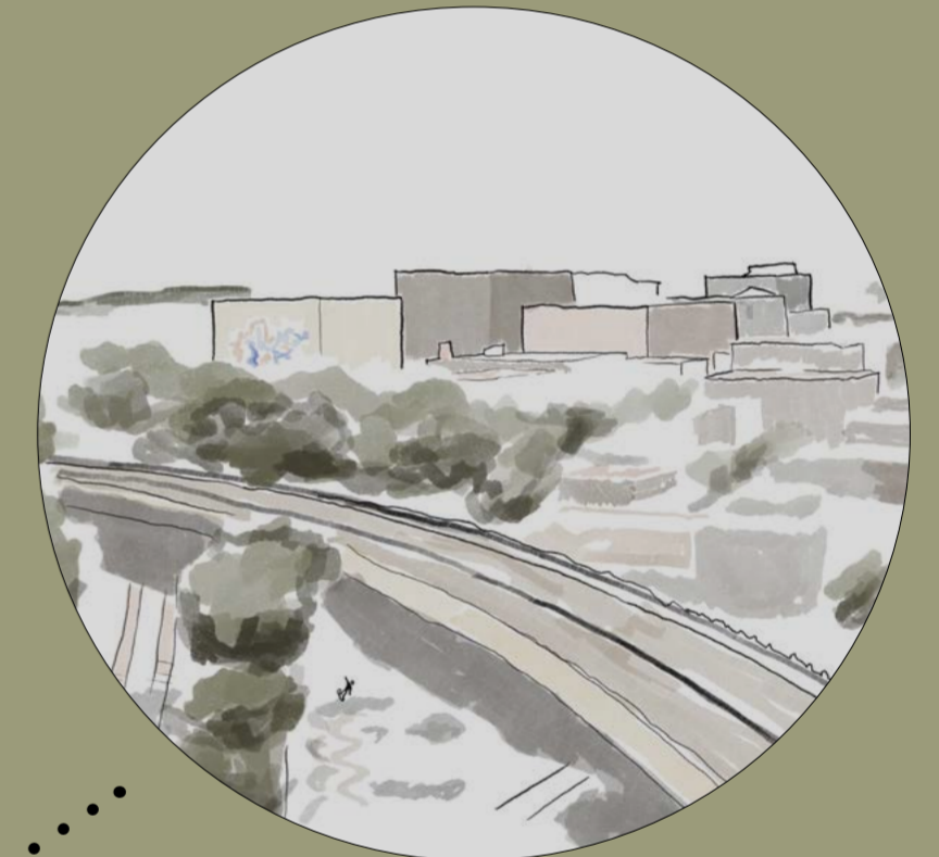
Skatepark - Section industrielle du Mile-End