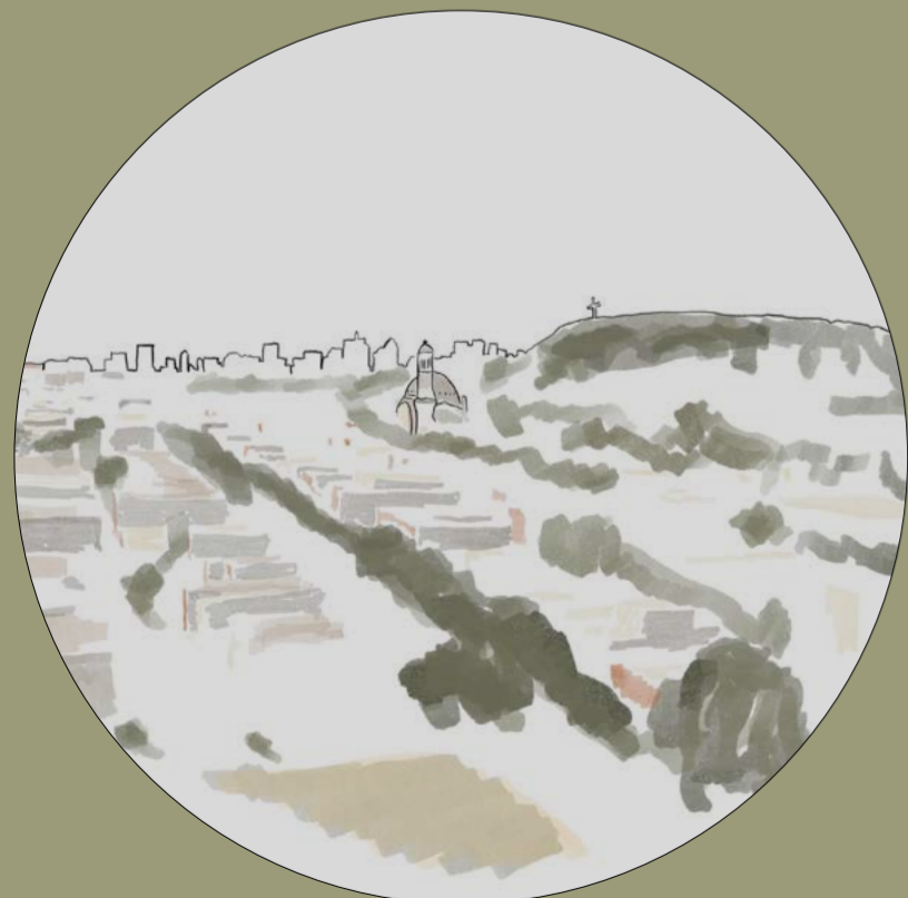
Église Saint-Michael - Centre-ville - Mont-royal