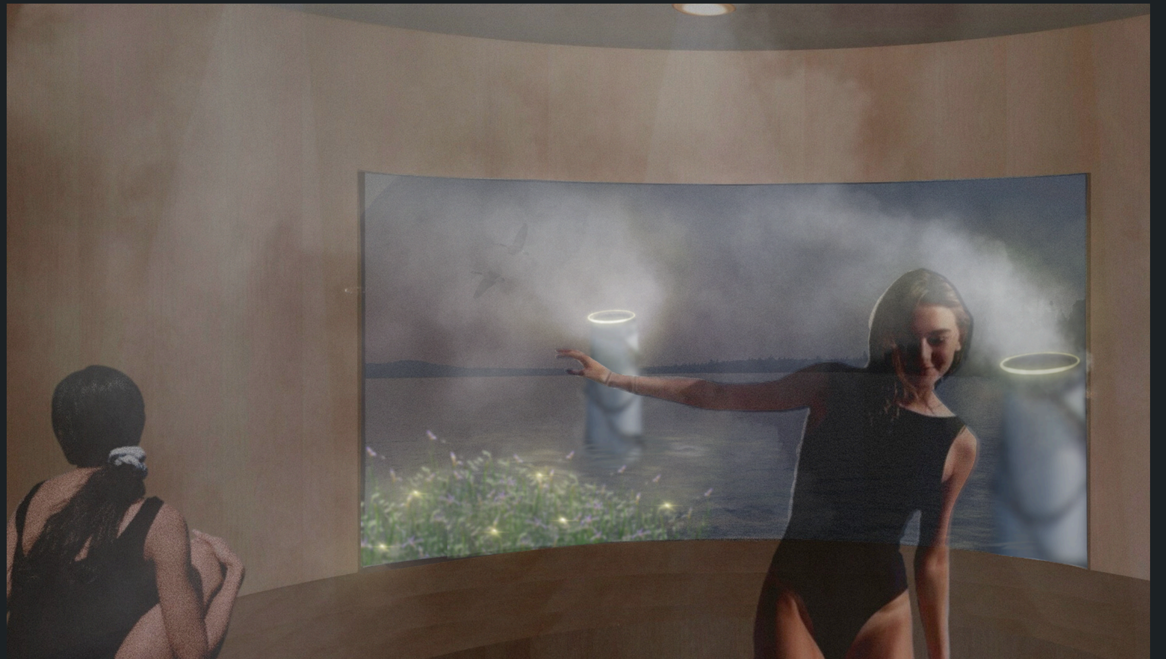
Réservoir en guise de bain de vapeur, Montréal