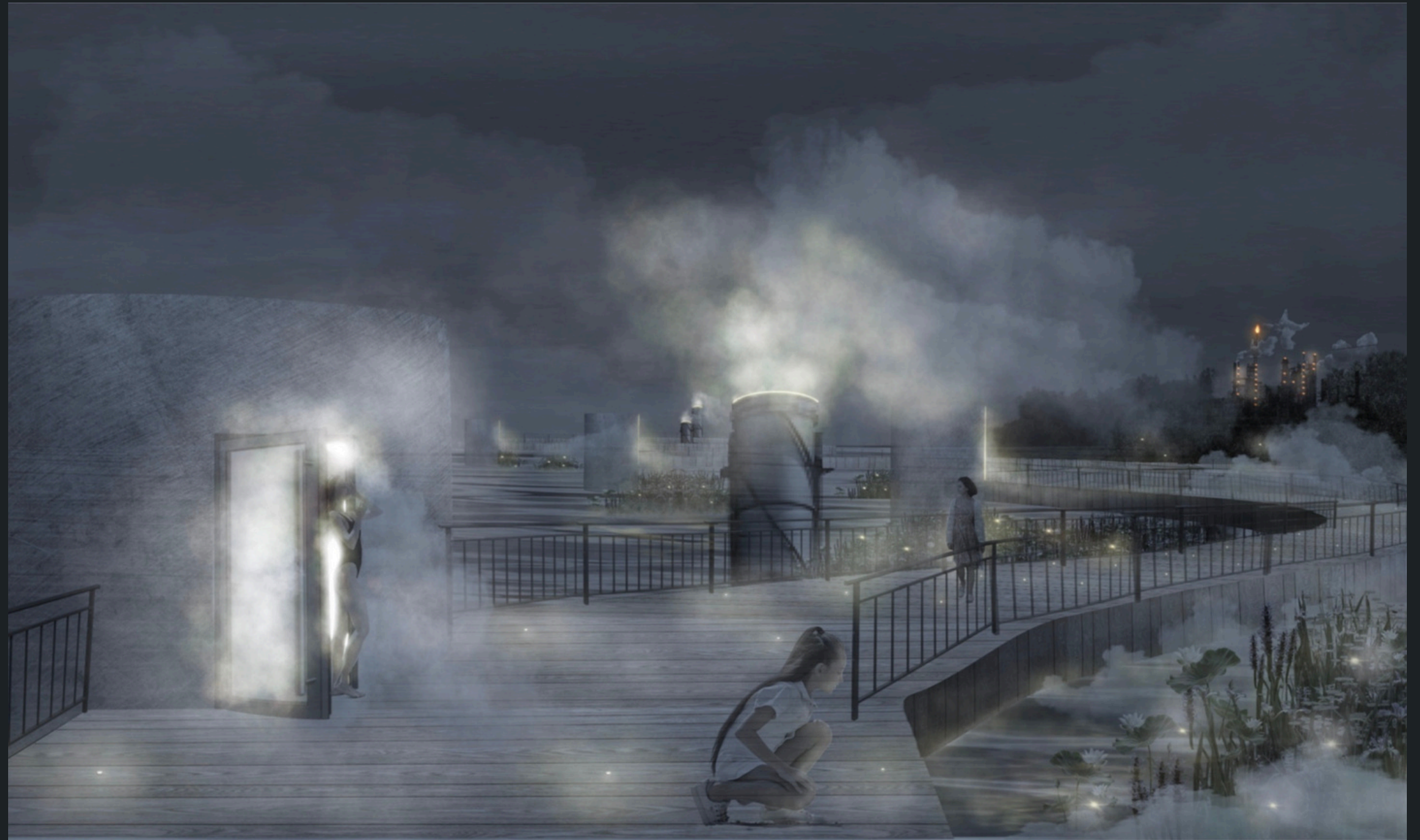
Promenade industrielle sur le fleuve Saint-Laurent, Montréal