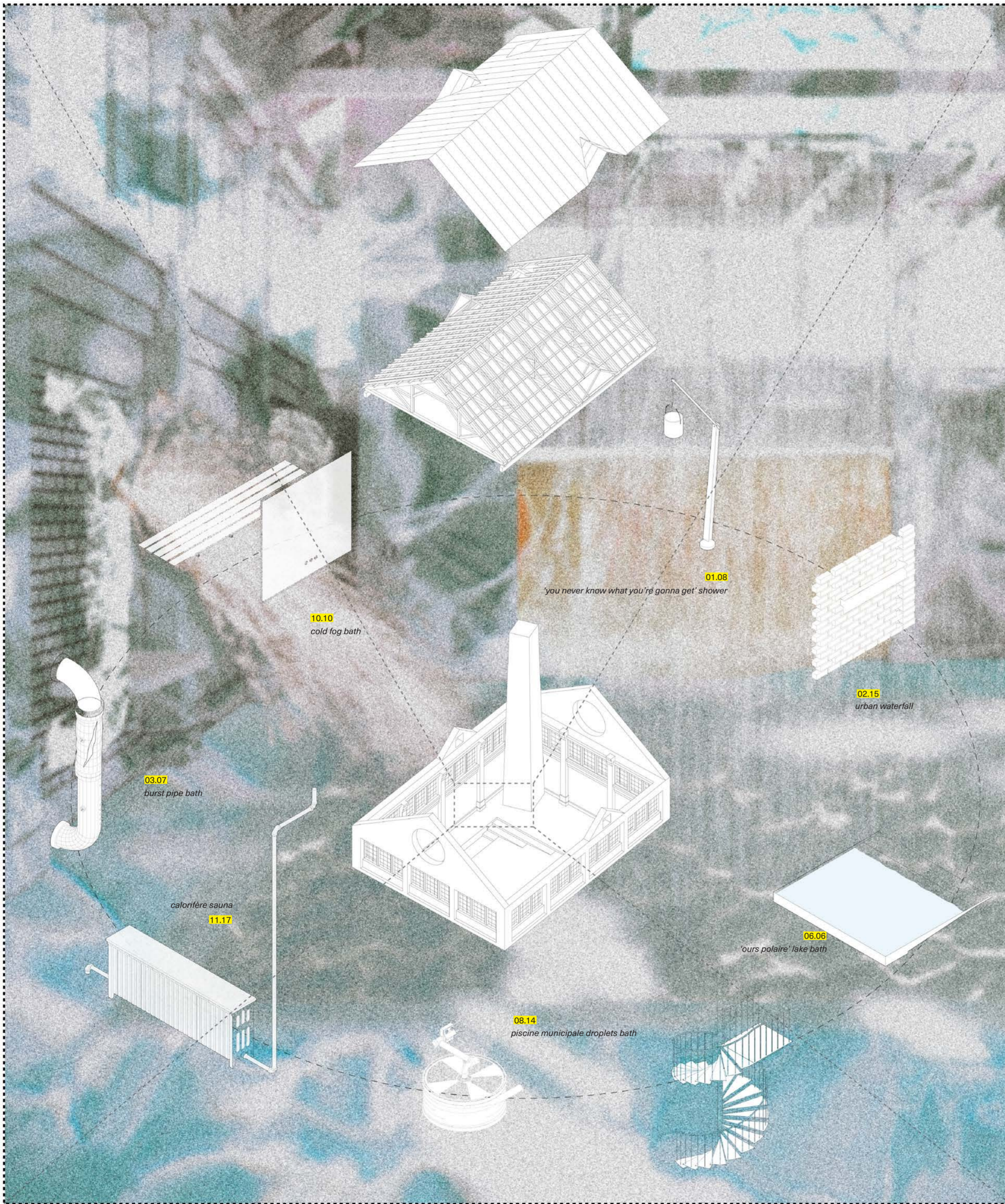
07.23 summerstorm bath (detail)