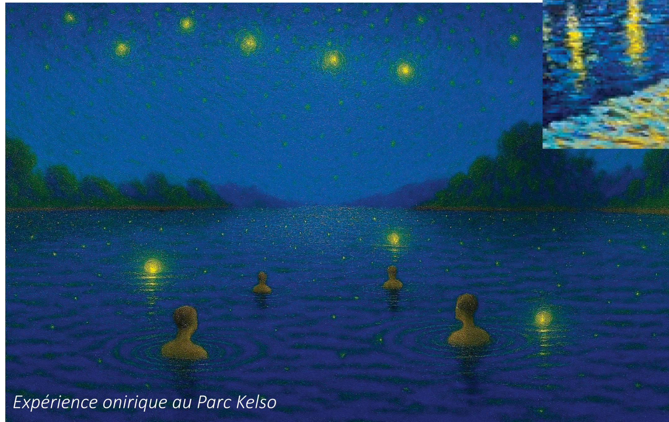
Expérience onirique au Parc Kelso