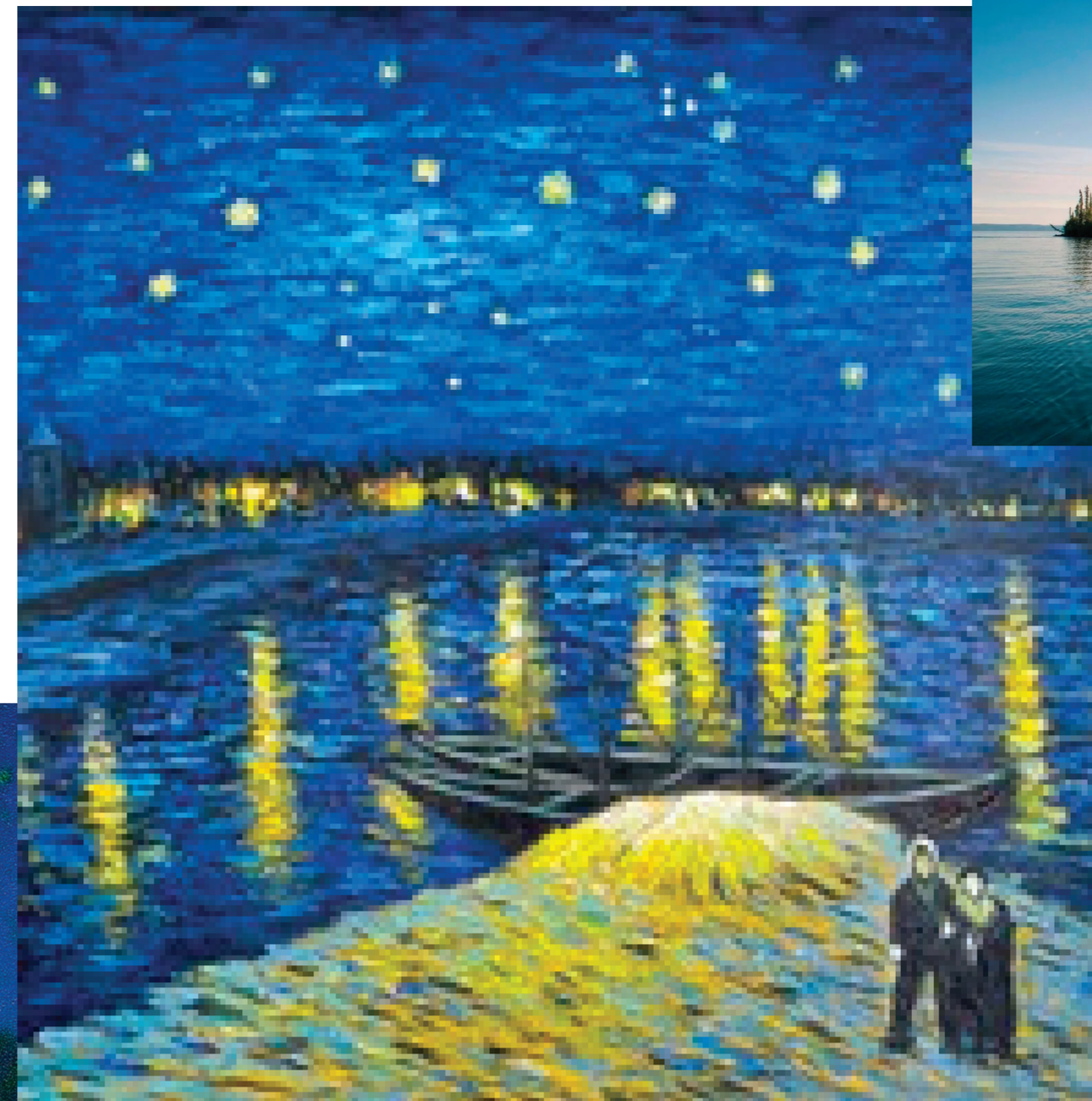
La Nuit étoilée sur le Rhône, 1888, huile sur toile

En 1888, Vincent Van Gogh réalise sa Nuit étoilée sur le Rhône , premier d'une grande série de tableaux consacrés à la lumière de la nuit. Cette œuvre post-impressionniste majeure exprime la fascination de l'artiste pour la lumière nocturne. Elle juxtapose des bleus profonds et des jaunes orangés éclatants, illustrant les reflets lumineux sur l'eau dans une atmosphère sereine et quasi-mystique.