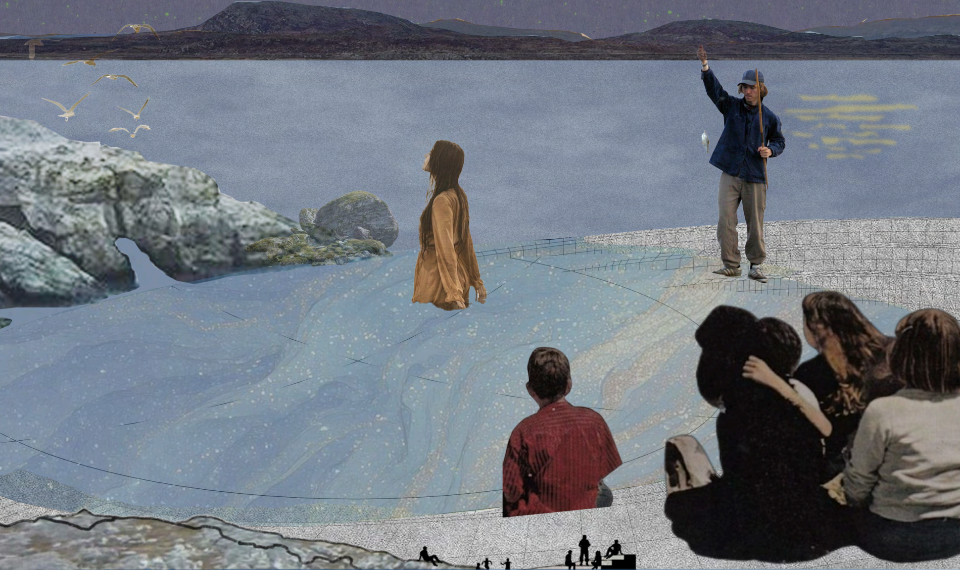
COUPE À MARÉE HAUTE