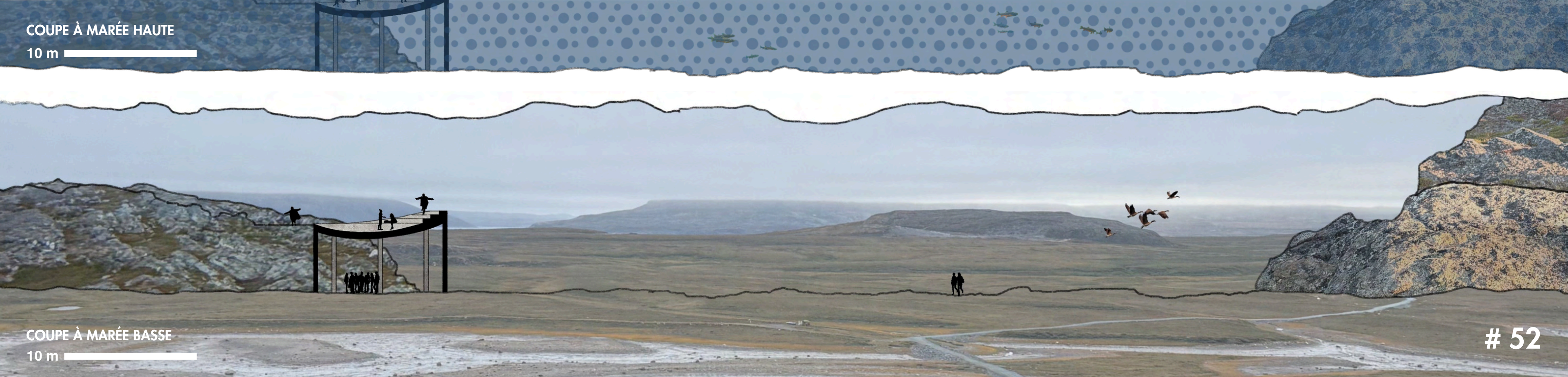
COUPE À MARÉE BASSE