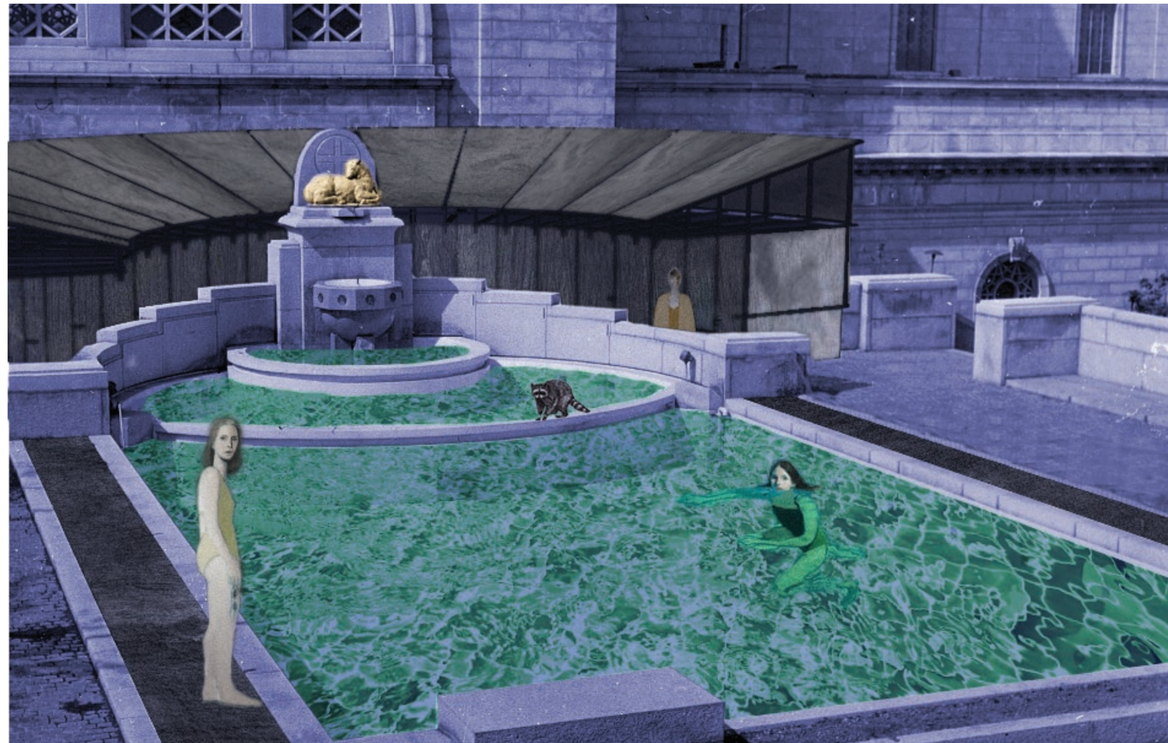
Image : 5 : Toshio, 2009, Flickr. 7 : Jonathan Wateridge, 2020. & L'Oratoire Saint-Joseph du Mont-Royal, 1970, Facebook.