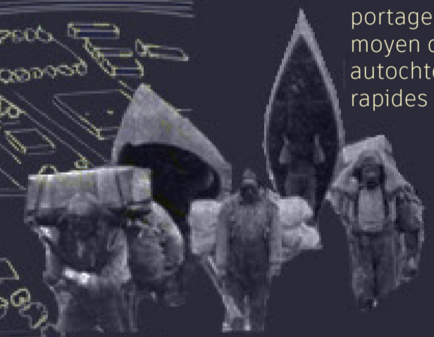
portage : autrefois le moyen de transport des autochtones contournant les rapides Lachine