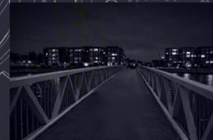
traverses du canal : union des deux rives