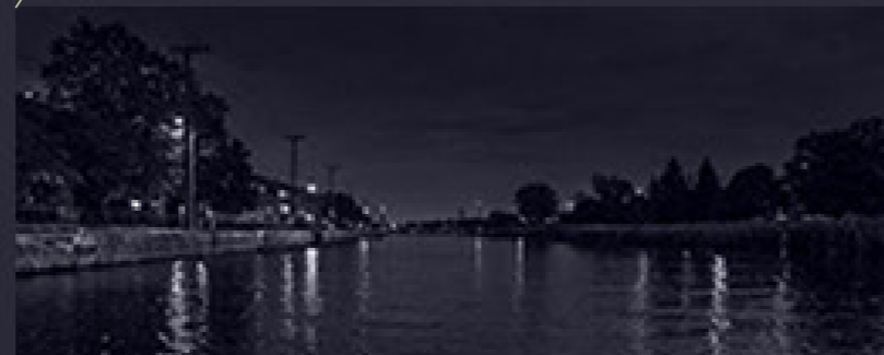
l'eau : actrice principale du lieu

S'inscrire aujourd'hui dans le canal, c'est réactiver ce lien ancien entre l'eau, le mouvement et la rencontre. Le projet prolonge cette mémoire en redonnant à l'eau une place active dans l'expérience du lieu. Le canal devient un nouvel axe animant le cœur de Montréal.