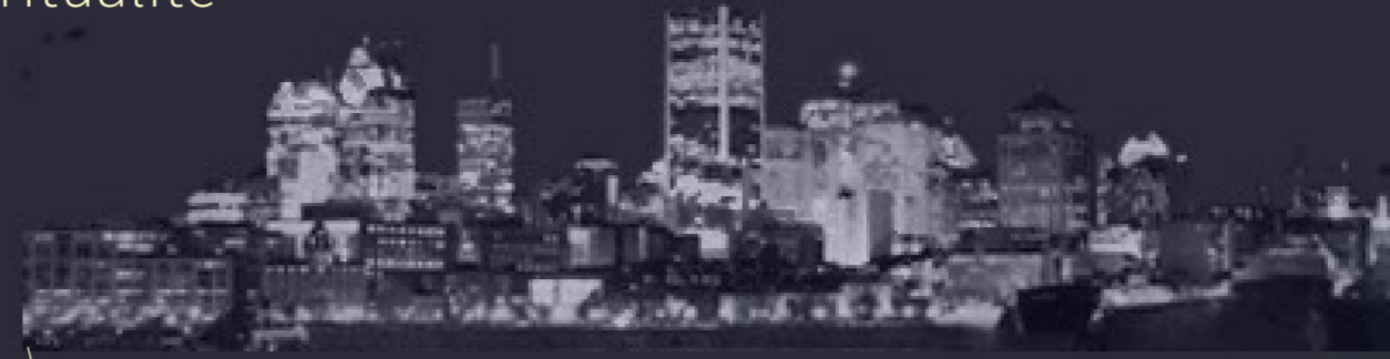
Centre-ville : percées visuelles rappelant l'essence de Montréal. La montagne et l'eau