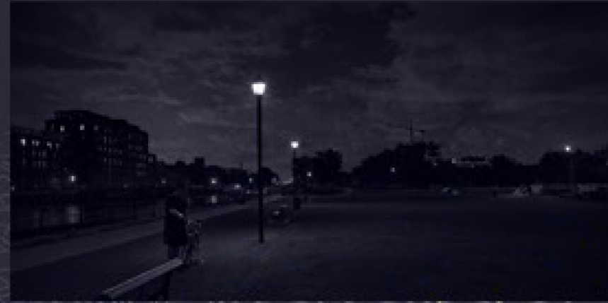
promenade actuelle longeant le canal

Le projet prend place au canal de Lachine, un lieu déjà profondément ancré dans la vie collective de Montréal. Aujourd'hui, ses berges sont un espace de promenade et de rencontre où se croisent habitants, cyclistes, nageurs et visiteurs. En s'implantant directement sur l'eau, le projet cherche à amplifier cette dynamique, faisant du canal non plus seulement un paysage traversé, mais un acteur central de l'expérience nocturne.