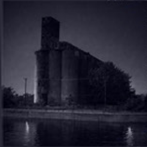
Nombreuses vues sur le patrimoine industriel longeant le canal

Ce territoire porte aussi une mémoire plus ancienne. Bien avant la construction du canal au XIXe siècle, le fleuve Saint-Laurent était marqué par les rapides de Lachine, qui rendaient la navigation difficile. Des peuples autochtones utilisaient déjà ce lieu comme passage et portage pour contourner les rapides. L'eau y était perçue non seulement comme une voie de déplacement, mais comme une présence essentielle reliant les humains au territoire et au cycle du vivant.